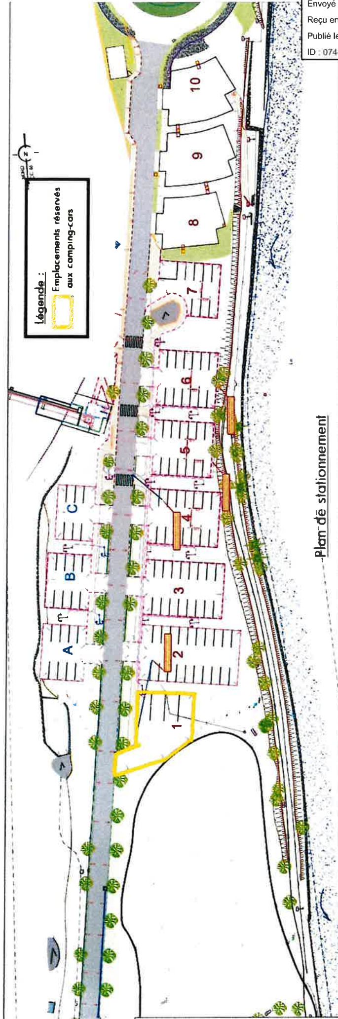
Plan de stationnement

"Vu pour être annexé à l'arrêté municipal N° PM/2024/25/P/LDF"