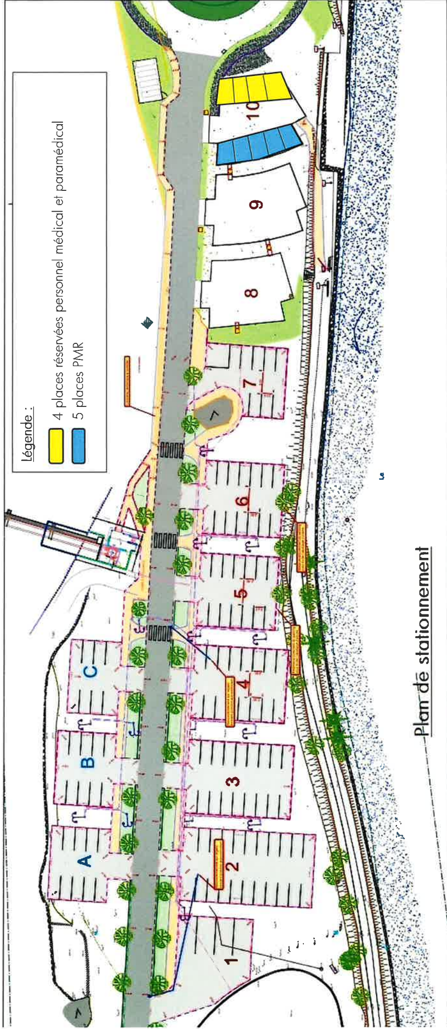
Plan de stationnement

Vu pour être annexé à l'arrêté municipal n° PM/2026/02/P/LBF